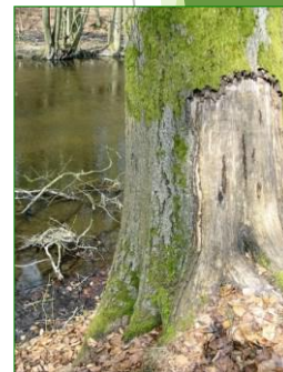
Dégâts de castors