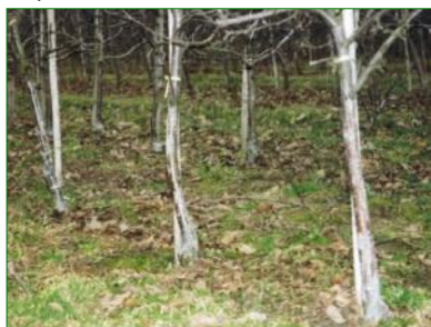
Fruitiers protégés contre les lapins