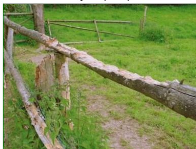
Dégâts de chevaux sur clôture non protégée