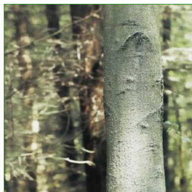
Les troncs protégés conservent un aspect naturel

Produit prêt à l'emploi. Conditionnement seau plastique refermable à anse de 10 kg.