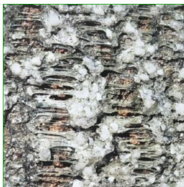
Détail agrandi d'une zone traitée il y a quelques années.