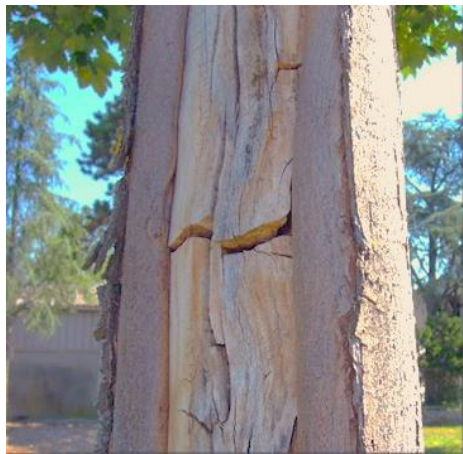
Tronc éclaté car non protégé

Les dommages (fissures, éclatements de l'écorce...) qui apparaissent sur les troncs des arbres sont généralement dus à la montée en température du cambium, et aux écarts de température entre le côté du tronc exposé au soleil et celui qui reste dans l'ombre (notamment pendant les heures de l'après-midi).