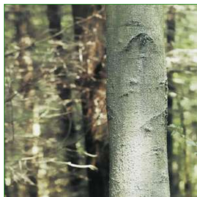
Les troncs protégés conservent un aspect naturel

Produit prêt à l'emploi. Conditionnement seau plastique refermable à anse de 10 kg.