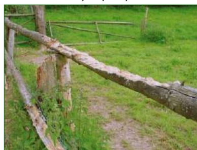
Dégâts de chevaux sur clôture non protégée