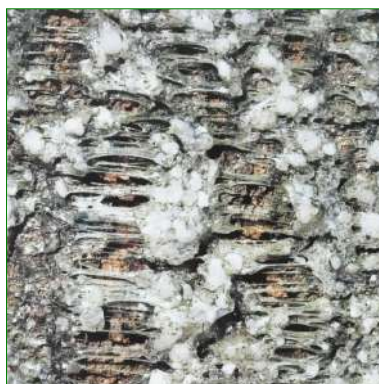
Détail agrandi d'une zone traitée il y a quelques années.