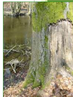
Dégâts de castors