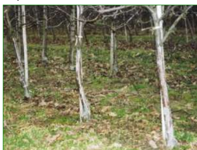
Fruitiers protégés contre les lapins